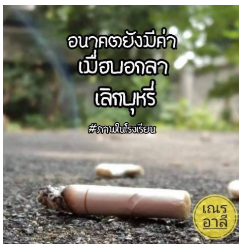
รูปที่ 1 ภาพโฟโต้วอยซ์ในโรงเรียนจากสามเณรแกนนำ Figure 1 Photovoice photo in school from novice leader

หลังจากที่ได้รับการคืนข้อมูลเกี่ยวกับพฤติกรรมกรรมการสูบบุหรี่ของสามเณรนักเรียนในโรงเรียนที่ทำการศึกษาและโรงเรียนข้างเคียงจากงานวิจัยในปีการศึกษาที่ผ่านมา ทำให้สามเณรแกนนำเริ่มรับรู้จำนวนสามเณรนักเรียนที่สูบบุหรี่มีปริมาณมาก ดังนั้นการถ่ายภาพโฟโต้วอยซ์เกี่ยวกับการสูบบุหรี่ในวัด โรงเรียน และชุมชน จึงเป็นการเริ่มต้นให้สามเณรแกนนำค้นหาปัญหาเกี่ยวกับการสูบบุหรี่ด้วยตนเอง ซึ่งจากภาพโฟโต้วอยซ์ พบว่ามีเศษบุหรี่และซองบุหรี่ที่ถูกทิ้งไว้ทั้งในวัด โรงเรียน และชุมชน ดังรูปที่ 1 และ 2