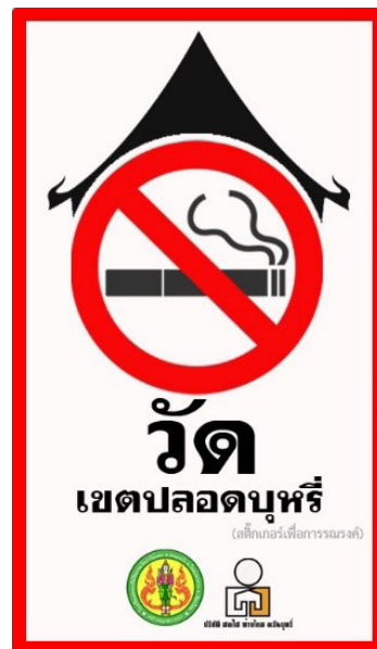
รูปที่ 4 สติ๊กเกอร์ในการรณรงค์การไม่สูบบุหรี่