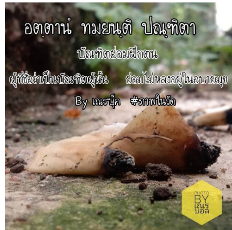
รูปที่ 2 ภาพโฟโต้วอยซ์ในวัดจากสามเณรแกนนำ Figure 2 Photovoice photo in temple from novice leader

จากการบรรยายภาพตามหลักการ SHOWeD ของกลุ่มแกนนำเกี่ยวกับการสูบบุหรี่ในโรงเรียน พบว่า มีการทิ้งเศษบุหรี่และก้นกรองบุหรี่ในโรงเรียน ซึ่งบุหรี่ที่ถูกทิ้งไว้เหล่านี้มาจากสามเณรและญาติโยมจากภายนอกที่มาร่วมงานบุญในวัดข้างโรงเรียน ทำให้เกิดความสกปรกและเป็นมลพิษต่อสิ่งแวดล้อม รวมทั้งการสูบบุหรี่ยังทำให้สิ้นเปลืองค่าใช้จ่าย ส่วนการสูบบุหรี่ในวัด ภาพโฟโต้วอยซ์แสดงให้เห็นถึงซองบุหรี่หรือก้นกรองบุหรี่ที่ตกอยู่บนพื้นในบริเวณวัด สาเหตุเกิดมาจากพุทธศาสนิกชนที่มาร่วมงานบุญมีการสูบบุหรี่แล้วทิ้งก้นกรองหรือซองบุหรี่ไม่ถูกที่ ส่วนในชุมชนภาพโฟโต้วอยซ์ที่ได้รับการถ่ายก็เป็นไปในทิศทางเดียวกับภาพจากโรงเรียนและวัด คือมีการทิ้งเศษซากบุหรี่ตามท้องถนนหรือสถานที่สาธารณะ ซึ่งการสูบบุหรี่ส่งผลกระทบต่อผู้ที่อาศัยอยู่ในพื้นที่ชุมชนนั้นเนื่องจากการได้รับควันบุหรี่มือสอง