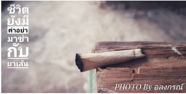
รูปที่ 5 ภาพที่ถ่ายด้วยกล้องจากสามแฉกรุ่นนักเรียน